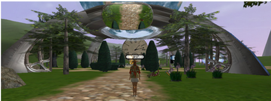
Fig. 8 – Ponte virtuale in ActiveWorlds.