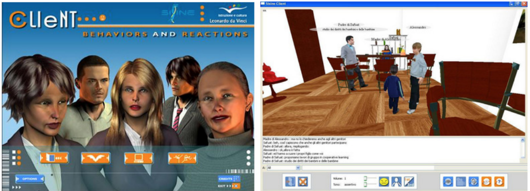
Fig. 6 – Ambiente SISINE.

culturale nelle scuole . Ebbi così modo di sperimentare direttamente altri ambienti 3D di incontri sincroni completamente diversi.