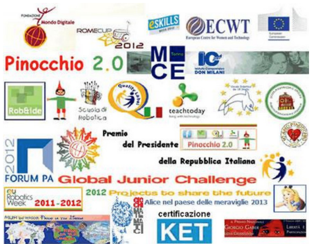
Fig. 3 – Evoluzione di Pinocchio 2.0 nel 2013.