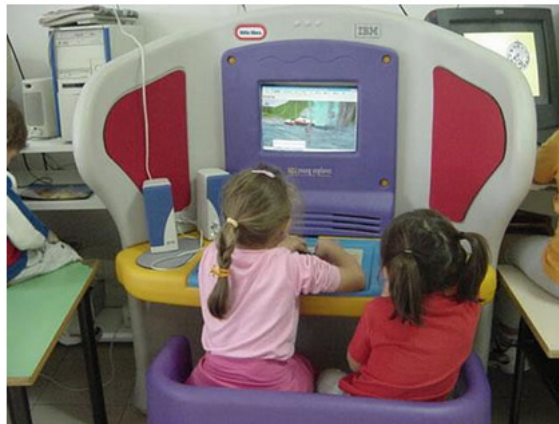
Fig. 5 – Bambine giocano nei mondi virtuali utilizzando il plasticone IBM.

Proposi i mondi attivi per percorsi di formazione, autoformazione ed apprendimento ad Altrascuola , per corsi con ADA (2002); al CINECA , per il portale Biblioscuole (2005/2007); ad ALINET per corsi Didaweb (2001); ad INDIRE, per i percorsi PuntoEdu (2002); al MIUR ed alla RAI per ilDivertiPC (2005); all'ITD-CNR per HSH@Teacher (2004); KIDSMART (dal 2004 al 2007)