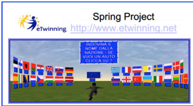
Fig. 7 – Screenshot della chat "A bridge made of flowery flags" con la Romania. http://www.descrittiva.it/calip/Giannini-Linda-pres-finale-gruppo.pdf

Sempre nell'anno scolastico 2006/2007, anche attraverso i mondi virtuali, realizzai il progetto Spring Project come un ponte con la Romania e nel 2008 e fui invitata dall' Ufficio Scolastico Regionale per il Lazio a presentare l'esperienza in qualità di messaggero eTwinning.