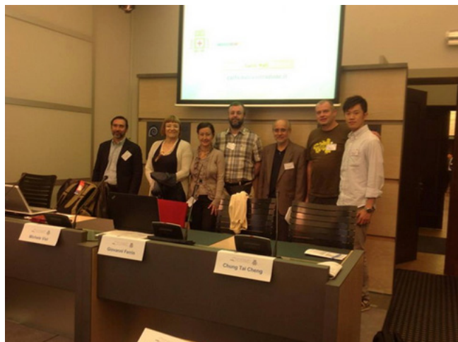
Fig. 9 – Foto di gruppo nella sezione challenges in Bruxelles.

In tutte queste esperienze fondamentale resta ovviamente la capacità di saper ben distinguere cosa è reale, cosa è fantastico e cosa è virtuale, così da evitare che ogni soggetto coinvolto perda un equilibrio sia interiore che esteriore. Ritengo inoltre importante la cooperazione e la collaborazione, senza di queste molti dei percorsi avrebbero perso la significativa valenza educativa, didattica e di ricerca.