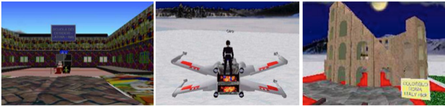
Fig. 1 – La scuola dei desideri, volo su jet e... il Colosseo.

A questo proposito venni chiamata ad intervenire come esperta in programmi della RAI quali Mediamente , Mosaico, Multimediascuola . Presentai inoltre il progetto presso il CILEA (Consorzio Interuniversitario Lombardo per l'Elaborazione Automatica) a Milano in occasione di NIR'99 (Network Information Retrieval – Italia) oltre che Apprendimento e cooperazione on line in occasione del primo Ted di Genova, nel 2001.