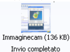
Immaginecam (136 KB)