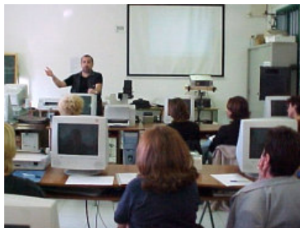
illustrazione 2- un momento di incontro-confronto per l'avvio della sperimentazione

In ogni regione è presente una scuola con un certo retroterra d'esperienza maturata nello specifico didattico (presenza di classi "esperte") e una scuola senza esperienza specifica (presenza di classi "in avvio") e nel mese di ottobre 2003 si sono svolti incontri di avvio del progetto, con la consegna del materiale necessario e un primo confronto sulle linee guida di proposta didattica da progettare nelle classi dalle insegnanti coinvolte.