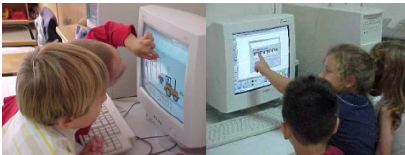
Illustrazione 1 - bambine/i della scuola dell'infanzia alla scoperta di Micromondi

I materiali raccolti (diari di bordo , progetti, fotografie, video) e le testimonianze dirette degli insegnanti che stanno sperimentando verranno quindi divulgati da febbraio in poi.