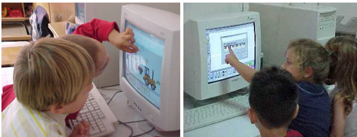
foto 1 bambine/i della scuola dell'infanzia alla scoperta di Micromondi

Il risultato atteso da questa prima fase è una raccolta di materiali ampia ed articolata che possa costituire una banca-dati per chiunque voglia da sé avviare un impiego didatticamente significativo delle tecnologie digitali nella fascia d'età 5-10 anni, dall'ultimo anno di scuola dell'infanzia al termine della scuola elementare.