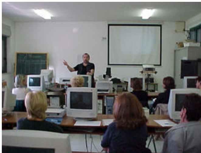
foto 2 documentazione di momenti di incontro-confronto per l'avvio della sperimentazione

Gli autori hanno poi di persona provveduto ad assistere le colleghe in presenza, mentre una community EUN 5 appositamente allestita ha permesso la condivisione e il confronto in rete, oltre lo scambio delle documentazioni e degli elaborati.