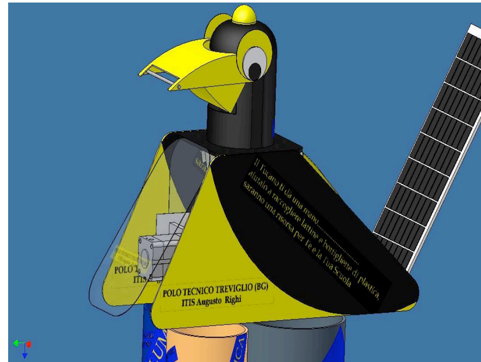
Robot Tucano per lo smistamento dei rifiuti urbani progettato dagli studenti dell'ITIS di Treviglio (BG)