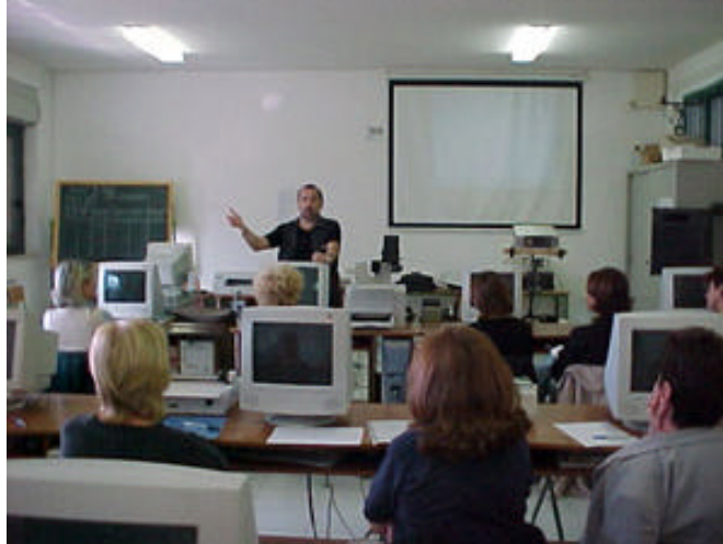
foto 2 documentazione di momenti di incontro-confronto per l'avvio della sperimentazione

In ogni regione è presente una scuola con un certo retroterra d'esperienza maturata nello specifico didattico (scuole presenza di classi "esperte") e una scuola senza esperienza specifica (scuole presenza di classi "in avvio") In ogni regione e nel mese di ottobre 2003 si sono svolti incontri di avvio del progetto, con la consegna del materiale necessario e un primo confronto sulle linee guida di proposta didattica da progettare nelle classi dalle insegnanti coinvolte.