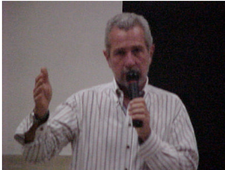
Partecipazione di tutto l'Istituto alla giornata di incontro confronto con il capitano Paolo Sottocorona metereologo de'